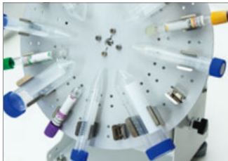
Suitable for widely tubes ,such as 50mL,15mL,10mL centrifuge tubes, Ø16mm,Ø13mm,Ø12mm,Ø8-9mm test tubes and the others.