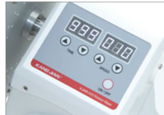
LED with backlight can display the current speed, time and operation mode, convenient for reading and setting.