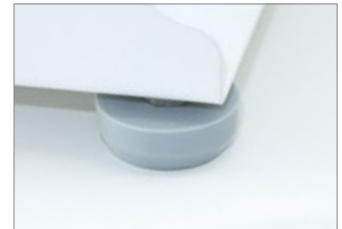
Silicone rubber feet, for more stable running.