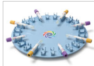
Small size clip: for Ø13mm test tube, Ø12mm test tube, 1.5mL centrifuge tube.