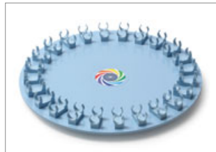
Medium size clip, for Ø16mm test tubes and 10mL, 15mL centrifuge tubes.