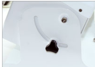
The mixing angle can be easy adjusted by adjusting handle.