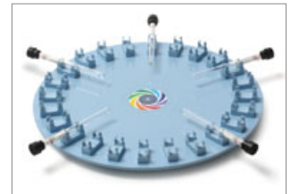
Extra small size clip: for Ø8-9mm test tube and 0.5mL centrifuge tube.